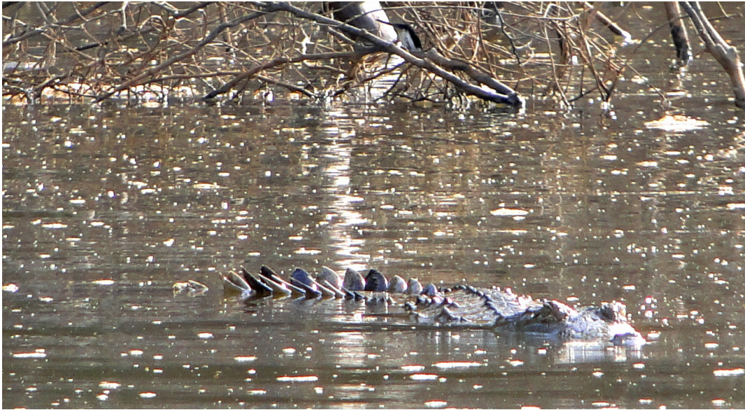
Figura 3. Individuo registrado el 21 de febrero de 2011 en Pozo Caimán (río Vichada).

dispersos, así como de nidos y de crías, a partir de información de pobladores locales entre la desembocadura del río Muco y La Raya (Rodríguez 2002). Por su parte, Lugo (1998) indica la presencia de un número no superior a 15 adultos a lo largo del río Vichada. Sin embargo, no se había realizado ningún registro visual en el sector de Pozo Caimán. De acuerdo a los datos de los pobladores locales a los que pudimos entrevistar, se considera que existe una sola zona de anidación en este tramo de río (entre Cumaribo y Santa Rita); los mismos informadores apuntan que dicha zona de anidación fue expoliada al menos en los últimos tres eventos reproductivos. Esto concuerda con el hecho de que pescadores y habitantes ribereños no hayan avistado crías ni juveniles en los últimos años.